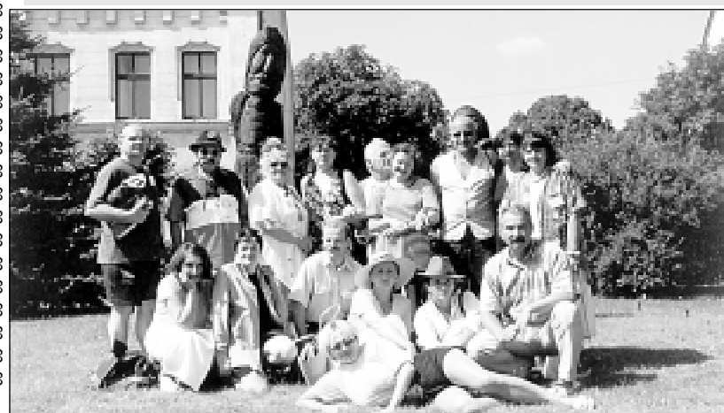
Uczestnicy VI Ogólnopolskiego Pleneru Malarskiego.

- Od kilku lat, zawsze latem czekam na plener. Bardzo lubię patrzeć, jak po-